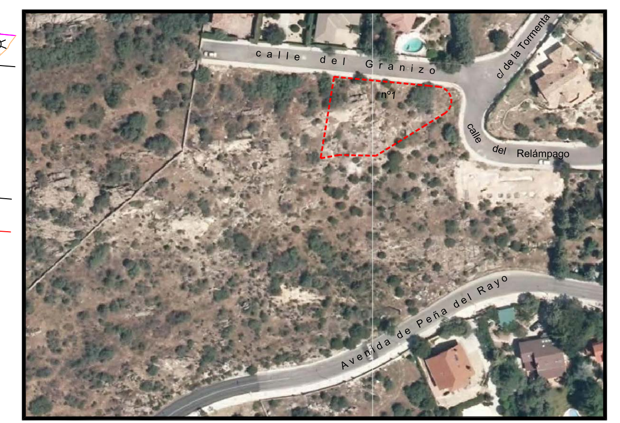
SITUACIÓN - FOTOGRAFÍA AÉREA

Con la finca "Extremo Suroeste Peña del Rayo", de propiedad municipal, en línea quebrada de 7,10m, 13,69m y 0,28m.